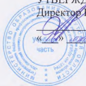
График работы стрелкового тира

(в учебном корпусе по адресу ул. Трудовая, 20)